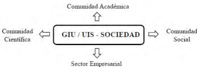
Figura 2: La Gestión de la Investigación Universitaria y la Sociedad

El modelo propone como centro la sociedad (Figura 2), teniendo en cuenta el compromiso social de la UIS, en la medida en que busca que la interacción con la comunidad académica, científica y social, y el sector empresarial sean más activa, a partir de procesos de investigación como una actividad permanente dentro del quehacer de la universidad, permitiendo mantener control sobre el resultado esperado, garantizar la pertinencia del capital intelectual de la institución, y replantear sus acciones en relación con las responsabilidades frente a la comunidad donde se encuentra inmerso el campus universitario.