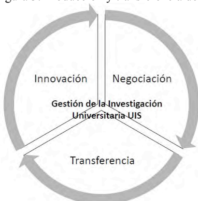
Figura 3: Producción y transferencia de conocimiento que basa el modelo de la GIU