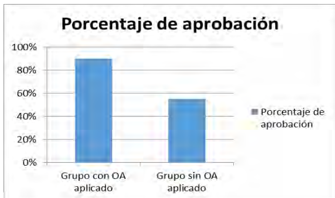
Figura 5 Porcentaje de aprobación en relación a la aplicación del OA.

Cabe mencionar que ambos grupos contestaron el módulo de evaluación de manera individual y simultáneamente en una sala de cómputo.