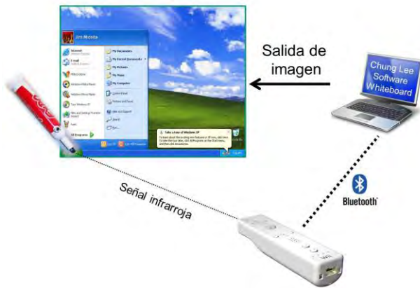
Figura 3: Diagrama de Conexión para replicar un PDI mediante el software Wiimote Whiteboard

En las figuras 3 y 4 puede observarse su diagrama general de conexión y su uso en aplicaciones básicas de Microsoft Windows así como la demostración del mismo creador de la propuesta utilizando la herramienta.