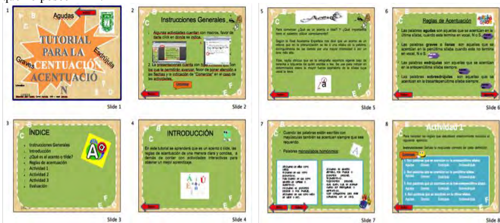
Imagen 1: Ejemplo de Imágenes del OA “Tutorial para la acentuación”

esta forma que el uso del OA se viera afectado por escasos niveles de dominio técnico (Harris, 2011). Mediante el uso de imágenes, textos e hipervínculos se permite a los usuarios desplazarse de un punto a otro dentro del OA; además, la utilización de macros (macro es un conjunto de comandos que se pueden aplicar con un solo clic) particularmente para la sección de evaluación de aprendizaje, provee una forma automática e inmediata de proporcionar resultados al usuario como retroalimentación, y permite al OA cumplir con la característica de presentar una etapa de Evaluación. Se buscó adicionalmente aplicar un diseño amigable que fomentara el uso y participación de los jóvenes de esa edad, logrando capturar su atención en el juego de una manera dinámica e interactiva, representando un excelente recurso a ser utilizado por un PDI en el aula. Sin embargo, como se mencionó previamente, uno de los retos principales fue utilizar el OA en instituciones educativas que no poseen PDI.