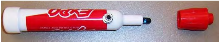
Figura 2 Prototipo de pluma infrarroja

Los elementos básicos que se requieren para una implementación de este tipo son: