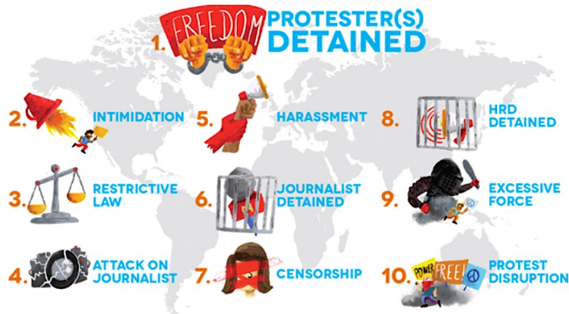
Figura 1. Top ten de violaciones Freedom House

Para el estudio propuesta se plantea la utilización de la metodología cualitativa deductiva que utiliza la información para identificar los temas y categorías emergentes; monitorear las restricciones legales y extralegales, sobre la base de las diez principales violaciones de las libertades cívicas que establece Freedom house: Protester (s) detained, intimidation, restrictive law, attack on journalist, harassment, Journalist detained, censorship, hrd detained, excessive force, protest disruption .