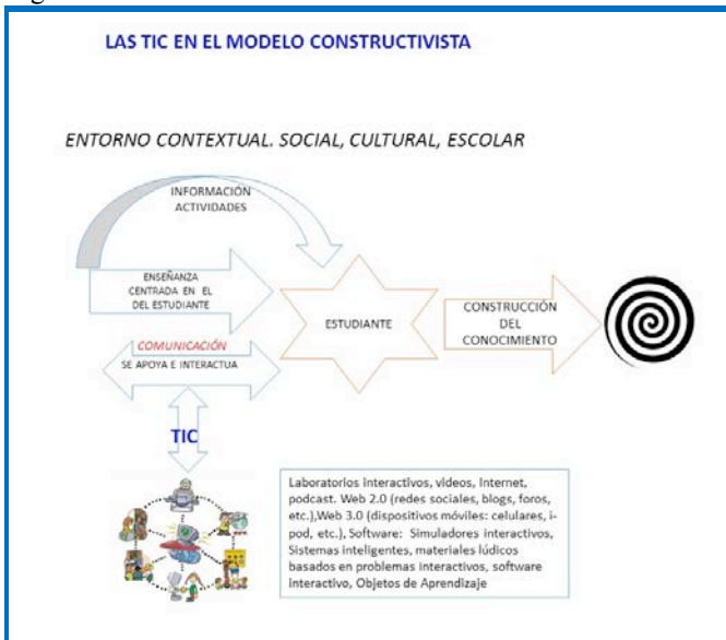
Figura 3: Modelo de enseñanza socio-constructivista basado en TIC