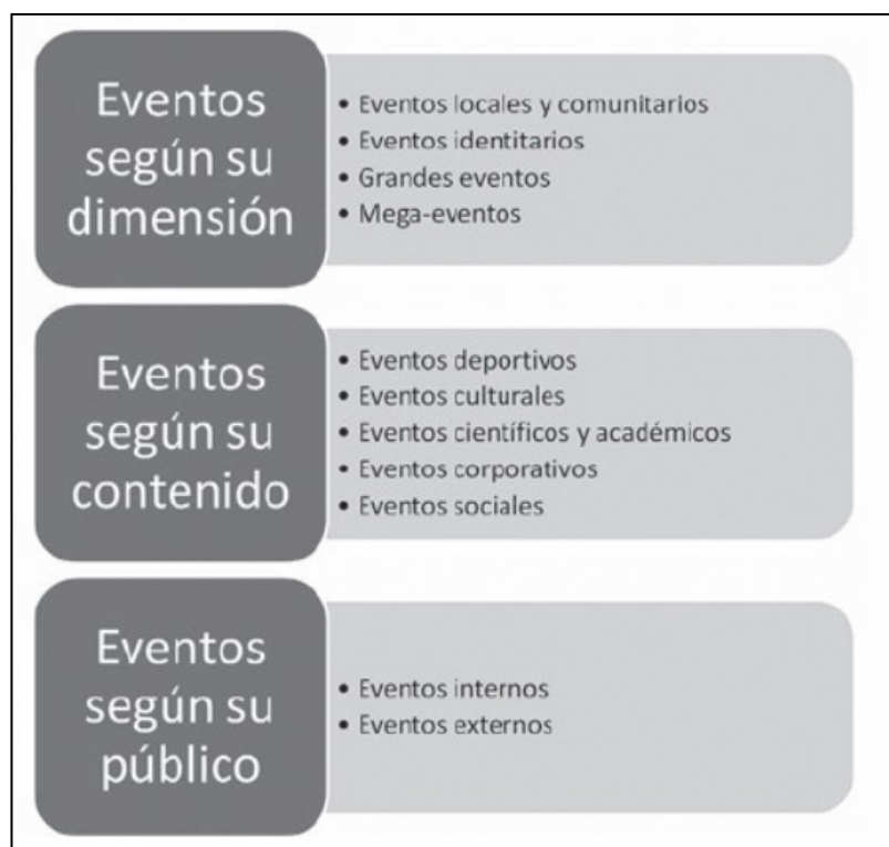
Figura 1. Tipos de eventos

Por otra parte, Jiménez-Morales y Alonso-Panizo (2017) categorizan los eventos según su dimensión, su contenido y el público destinatario, diferenciando entre los tipos reflejados en la figura 1.