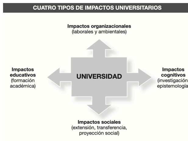
Figura 2. Impactos universitarios desde la perspectiva del BID

Los discursos de la RSU, vienen permeados geopolíticamente por organizaciones privadas que conducen a la universidad hacia perspectivas del desarrollo económico. Ejemplo de las organizaciones internacionales que se dan a esta tarea es el Banco Interamericano de Desarrollo que hace énfasis en alineamiento que se toma en torno a perspectivas empresariales fincadas en estándares de calidad y que encadenan a la universidad a una responsabilidad inmersa en preceptos de gestión fundamentada en concepciones provenientes de las ciencias administrativas (impactos organizacionales, cognitivos, sociales, educativos) (Vallaey, 2009), (ver figura 2).