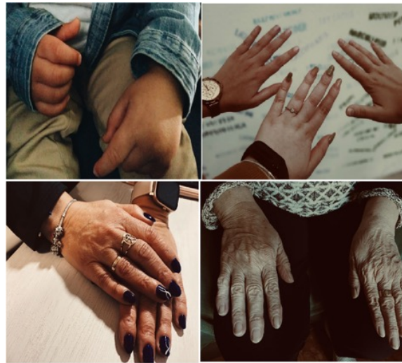
Figura 1. Proyecto sobre el ciclo de la vida: infancia, adolescencia, edad adulta y vejez