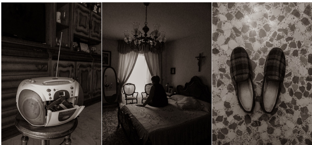
Figura 3. Proyecto sobre la soledad: la soledad que me dejaste