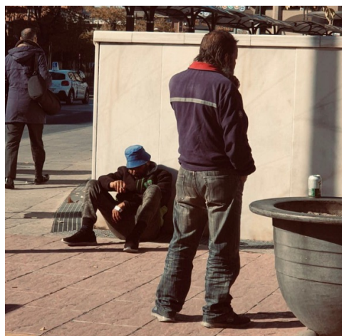
Figura 2. Proyecto sobre la desigualdad social: los olvidados