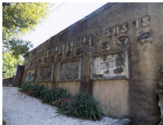
Figura 21. Relieve del Sacrificio de Túpac-Amaru.