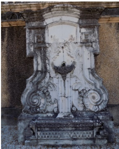
Figura 27. Fuente decorativa.