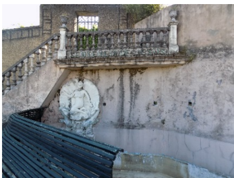
Figura 41. Figura femenina en la parte inferior del balcón de la Sentencia de Jesús.