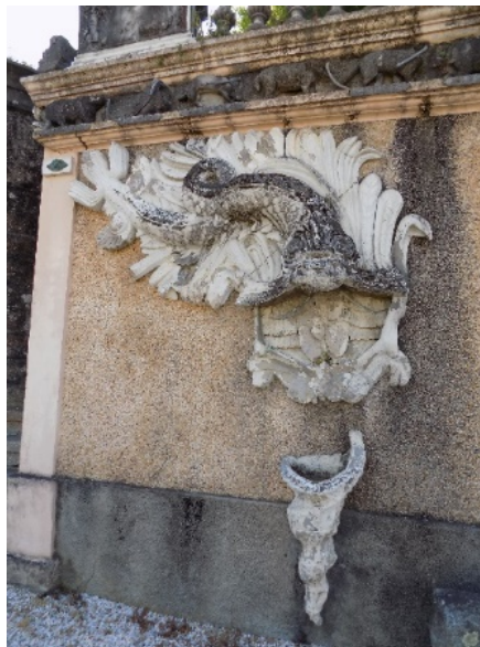
Figura 25. Animales Fantásticos.