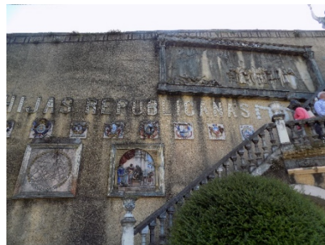
Figura 32. Escaleras de acceso al segundo nivel.

Para subir del primer al segundo nivel, podemos hacerlo por tres zonas del Parque. Una manera sería subiendo las escaleras, siguiendo el muro de los relieves de los cuadros (fig.32). Otra forma sería por el extremo contrario, es decir por donde entramos cuando llegamos al Parque por la pasarela, subiendo las escaleras donde está ubicada la fuente del barril, y por último, podemos subir por las escaleras, situadas enfrente de la entrada del Estanque del Retiro, en donde se puede ver un cilindro de granito que sirvió de base a la Fuente de Cupido y al que rodean una escaleras adornadas con jarrones de estilo versallesco (fig.33).