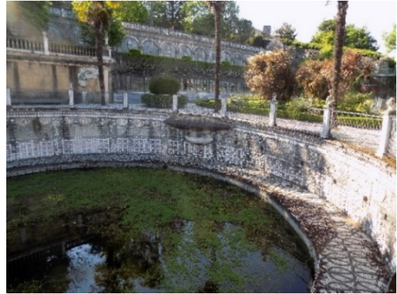
Figura 14. Relieve del dirigible.

A lo largo del muro que rodea a todo el Estanque, se puede observar una pieza que se asemeja a un dirigible con cesta (fig.14), construido con técnica de reproducción por copia, con molde o vaciado, y dos vehículos híbridos rodados a vapor (fig.15), que se encuentra en gran relieve sobre la otra pared. Todo el muro se adorna con piedras de canto rodado y por conchas de moluscos.