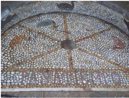
Figura 29. Suelo con patos y la palabra Pasatiempo.