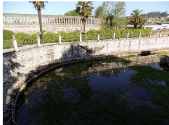
Figura 15. Vehículo híbrido.