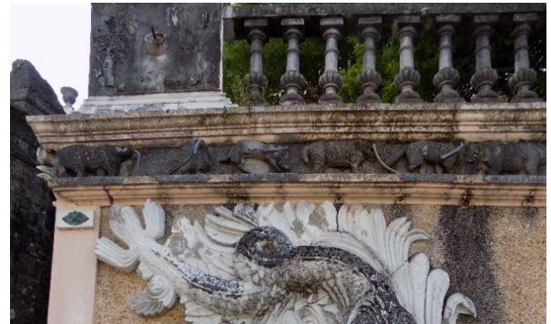
Figura 28. Friso de animales.

En la parte superior de las fuentes y debajo de la balaustrada del segundo nivel, un friso en alto relieve de animales, recorren todo el muro. Allí se encuentran, entre otros animales, culebras, cucarachas, búfalos, focas, avestruces y liebres, en hormigón pórtland, aunque como en otros muchos elementos del Pasatiempo, la mayoría de los relieves, han desaparecido casi completamente (fg.28).