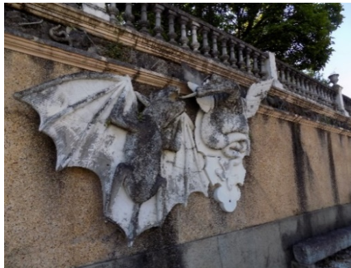
Figura 24. Animales Fantásticos.

cuerpo de pez y cabeza monstruosa por la que saldría el agua que caía sobre una concha marina (fig. 25). En la otra mitad del muro situada más al sur, de nuevo su parte central estará ocupada por la misma fuente del murciélago. La técnica utilizada es la de modelado, vaciado. El material utilizado es de mortero de cemento pórtland y árido fino de río.