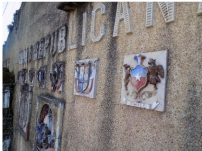
Figura 19. Muro con escudos de países de América del Sur.