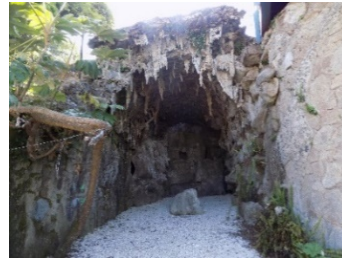
Figura 7. Entrada Gruta de Recolecta.

de la Recolecta (fig.7). Sobre el techo cuelgan estalactitas y dentro de esta gruta se observa, algo parecido a un nido de serpientes, que se encuentra adosado al muro en alto relieve, realizados con técnica de modelado, vaciado, aplicadas en el mismo lugar, y material de mortero de cemento pórtland y árido fino de río (Aguirre, 2016). En bajo relieve, y a cada lado de la entrada de la gruta, podemos ver sobre los muros, una jirafa de tamaño real (fig.8) y un elefante (fig.9), en material de piedra marina perforada y detalles en cemento. Sus nombres aparecen en cenefas con cantos rodados. Cabe señalar como anécdota, que el nombre de jirafa aparece escrito como «girafa» (parquepasatiempo.blogspot.com).