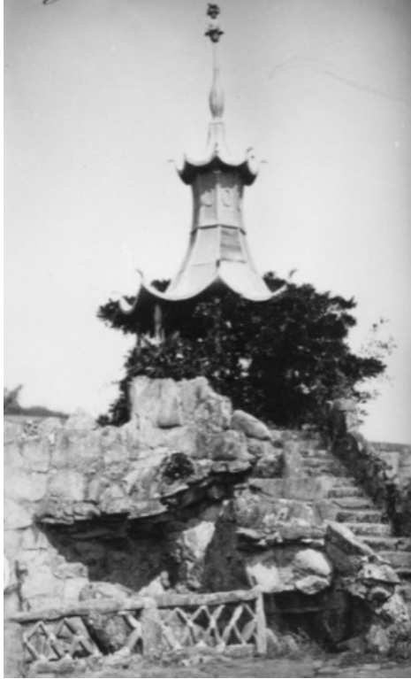
Figura 53. Mirador chinesco. Loty (1927-1933)

una veleta en donde se podía ver la silueta de una vaca y un agricultor (fig. 53). Su diseño es de tipo oriental. Hoy en día solo queda la estructura metálica (fig.54).