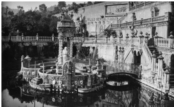
Figura 10. Islote del Parque del Retiro.

En una de las fuentes se distinguía dos niños sosteniendo el surtidor del agua. En la parte este, se encontraba otro elemento decorativo con formas redondeadas con una urna que terminaba en una especie de cúpula. Por último en la parte sur, otra fuente con nicho, contendría un jarrón por el que saldría el agua.