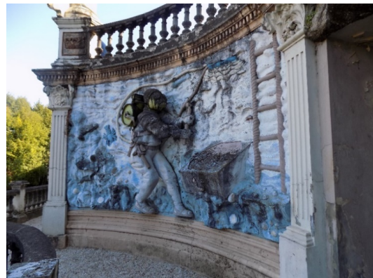
Figura 36. Buzo pescando un tesoro.

El muro, continua revestido con azulejos y mosaicos de vistosos colores como jarrones, flores, pájaros, árboles y figura humana. A continuación, a la altura de la fuente de cupido, nos encontramos la representación de un buzo que está pescando un tesoro en el fondo del mar. En sus manos tiene un mazo, y un machete en el cinturón, y le rodean peces, moluscos y conchas marinas. La escafandra que lleva puesta el buzo, es lo que llama más la atención, porque el año en que se construyó, muy pocos visitantes, habrían visto semejante invento (fig.36). Dos pilastras sobre pedestales con capiteles corintios, acotan el alto relieve realizado en mortero de hormigón pórtland, con policromías.