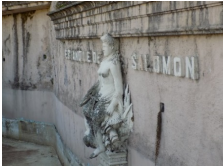
Figura 40. Estanque de Salomón

Se puede acceder a él, directamente por las escaleras que suben por la parte situada más al sur. Tres fuentes dos de ellas con figura de mujer, surtían de agua al estanque. Una de las estatuas aparece semidesnuda, con unas ramas en su mano derecha y situada entre las palabras donde se puede leer: «ESTANQUE DE SALOMÓN» (fig.40). La otra efigie se ubica debajo del grupo escultórico de la Sentencia de Jesús. Esta figura femenina aparece desnuda y ocupa el centro de una concha marina (fig.41). La otra fuente, se encuentra enfrente del muro y representa un rostro monstruoso por el que desde su cabeza, sale el agua al estanque. El material utilizado en todo este estanque es el de mortero de cemento pórtland (Aguirre, 2016).