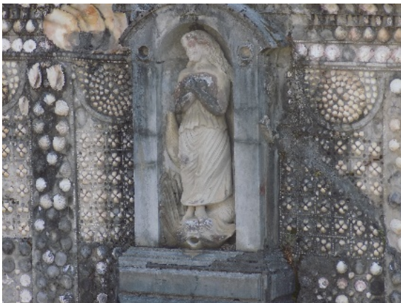
Figura 17. Fuente con figura de mujer.