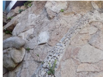
Figura 8. Relieve de jirafa.