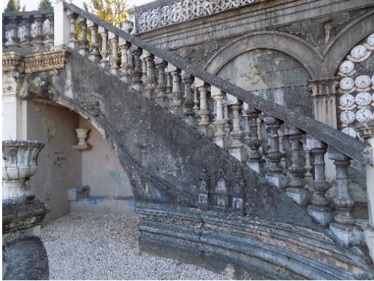
Figura 37 Habitáculo y paño del muro con funicular.

Seguidamente, sobre el muro que soporta la balaustrada y pasamanos de las escaleras, encontramos un funicular que desciende camino de la estación (fig.37).