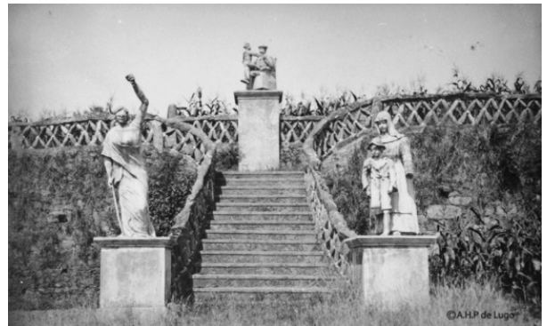
Figura 55. Estatua de mujer y la monja con niño.