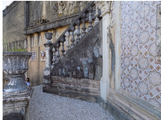
Figura 35. Muro de apoyo de escaleras con relieve de las religiones.

Entre las figuras realizadas en mortero de hormigón de pórtland, la de mayor altura parece que porta una mitra, por lo que podría ser un obispo católico. Cada figura, tenía encima en forma de semicírculo el nombre de la religión que representaba y un número, que podría ser la cantidad de personas simpatizantes de esa religión. Encima del obispo, quedan restos de algunas palabras que podrían decir Catolicismo y debajo 353 millones, que sería, en aquel momento, el número de simpatizantes en el mundo (parquepasatiempo.blogspot.com).