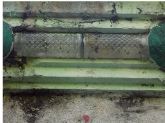
Figura 50. Cornisa fabricada con botellas.

Destacamos un detalle que se observa a lo largo del muro, y es la cornisa que se ve en la parte inferior de la balaustrada, realizada con botellas de cristal de anís, colocadas una tras otra, y unos adornos con hojas vegetales, en cemento (fig.50).