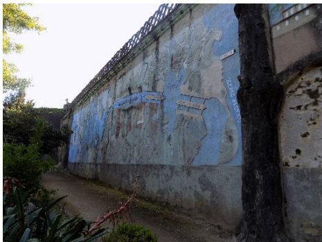
Figura 48. Relieve con el Canal de Panamá.

Además del Canal, también están representados, el valle del Gran Corte de Culebra comunicado con el lago de Miraflores que permitía la apertura del canal y las Esclusas de Gatún, de Miraflores y de Pedro Miguel, que permitieron la navegación (fig.48).