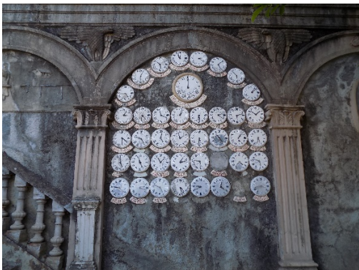
Figura 38. Esferas de relojes con la hora de las ciudades del mundo.

Al lado de las escaleras y ocupando uno de los arcos, vemos 41 esfera que señala la hora en cada reloj de las capitales principales del mundo, entre la que destaca con mayor tamaño y en el centro, la esfera de Buenos Aires (fig.38).