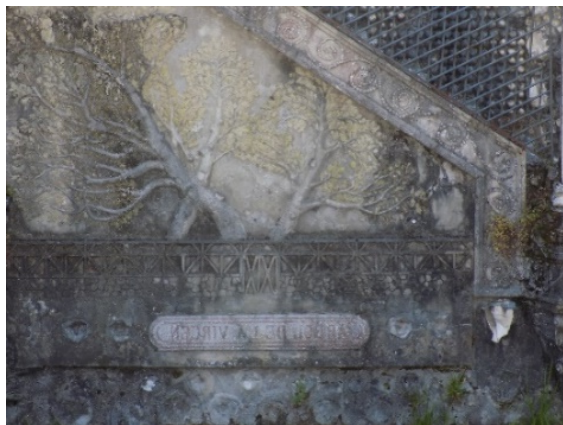
Figura 13. Árbol de la Virgen.