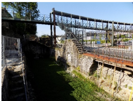
Figura 2. Entrada al Parque.

Los Estanques de la Gruta (fig.3) y de la boca de Hades, aunque desde arriba parecen independientes, por la parte más baja, están comunicados entre sí. Las paredes que rodean a los estanques, están cubiertas por conchas marinas y altos relieves con imágenes de animales como hipopótamos, oso, ballena, rinoceronte, dromedario y algún otro animal que no fue posible identificar. También se pueden observar los restos de una figura de ninfa, jarrones y una urna en la que, por imágenes antiguas, parecía albergar la estatua de una pescadora.