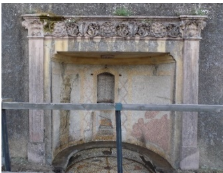
Figura 30. Habitáculo con urna.