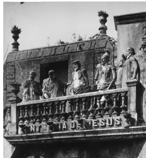
Figura 43. Sentencia de Jesús. (Años 30).