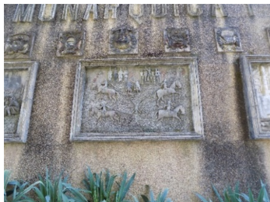
Figura 20. Cuadros en relieve sobre muro.

En el último de estos cuatro cuadros, aparece el sacrificio de Túpac-Amaru (fig.21) Este personaje que liderará la lucha de los indígenas de Perú contra las autoridades coloniales españolas, será apresado y sometido a torturas y descuartizamiento como se aprecia en el relieve del Pasatiempo. Es muy posible que sea una copia de alguna postal, que D. Juan compró en alguno de sus viajes.