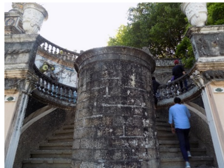
Figura 33. Escaleras que rodean al cilindro de granito