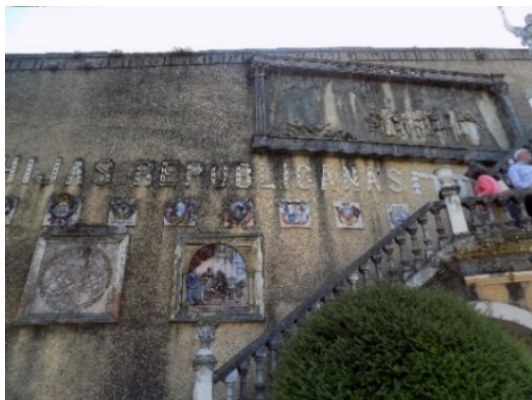
Figura 23. En lo alto del muro, el fusilamiento de Torrijos.