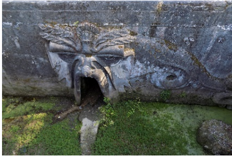
Figura 5. Boca de Hades.