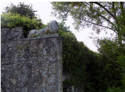
Figura 31. León rematando el muro.

A lo largo y encima del muro, que da a la avenida de Fraga Iribarne, había esfinges aladas que han desaparecido y leones que en su remate, en la parte inferior, tenían adornos con columnas realiza con cantos rodados y dibujos de azulejos de colores (parquepasatiempo.blogspot.com). Los leones estaban realizados en mortero de cemento pórtland y árido fino de río y la técnica utilizada es la de modelado, vaciado (Aguirre, 2016) (fig.31).