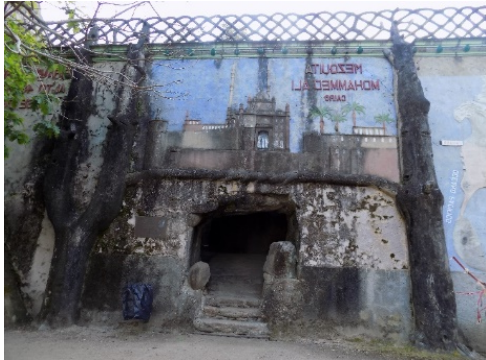
Figura 47. Mezquita con troncos de árboles.