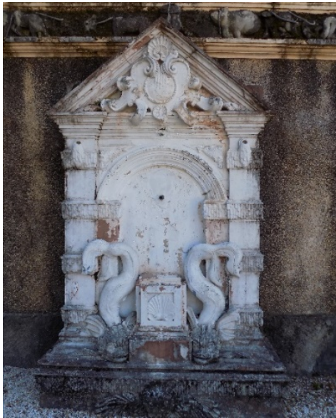
Figura 26. Fuente decorativa.

La técnica de las dos fuentes, es la de reproducción por copia, molde, vaciado. Pintado y el material es mortero de cemento pórtland y árido fino de río.