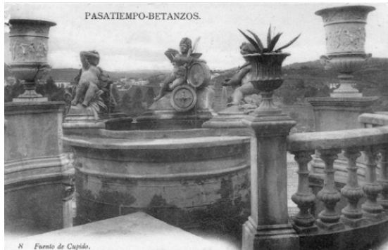
Figura 34. Fuente de Cupido (años 30).

Fuente: Álbum de Postales. (Archivo de Betanzos) ¿1920?