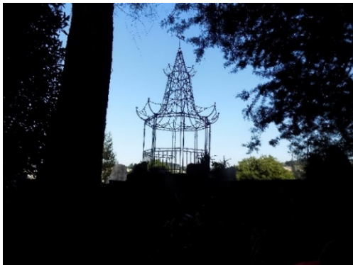
Figura 54. Mirador chinesco en la actualidad