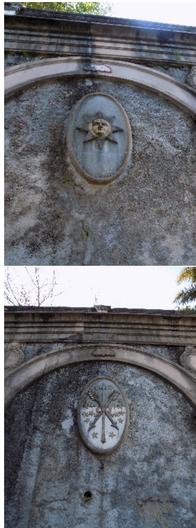
Figura 39. Escudos de Salta y Santa Fe (Argentina).

Con unos bancos de piedra rodeados de árboles y una entrada a la gruta en la parte norte, finaliza este nivel.