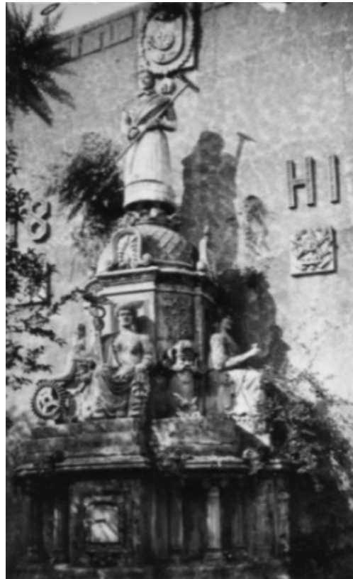
Figura 18. Fuente de la Agricultura.

En la parte baja, se aprecian columnas con capiteles que separan las tres máscaras que allí se encuentran, y por las que por sus bocas, sale el agua.