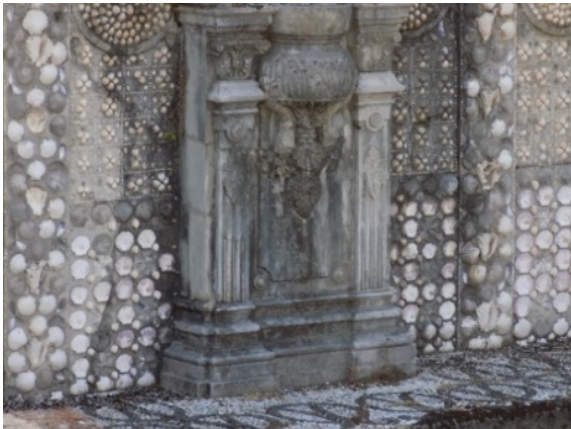
Figura 16. Fuente decorativa.