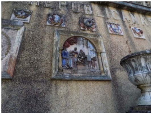
Figura 22. Santa Isabel curando a los tiñosos.