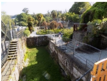
Figura 3. Estanque de la Gruta.