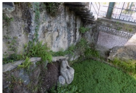
Figura 4. Mujer en el Estanque de la Gruta.

En la entrada por donde discurre el caudal del agua del estanque de la Gruta y enfrente de la ballena, aparece un llamativo motivo sobre el muro denominado la Boca de Hades o del infierno, llamada así porque al visitante le parecía, que entraba en las profundidades de la tierra (fig.5). Llama la atención por su espectacularidad, y D. Juan probablemente, se inspiró para su construcción en el parque de los monstruos o de la boca del infierno de Bomarzo (Italia). 1