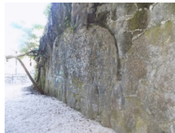
Figura 9. Relieve de elefante.