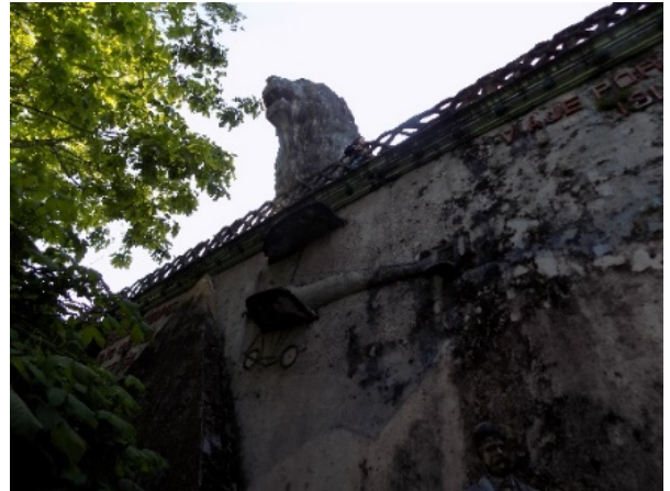
Figura 49. Biplano sobre el muro.