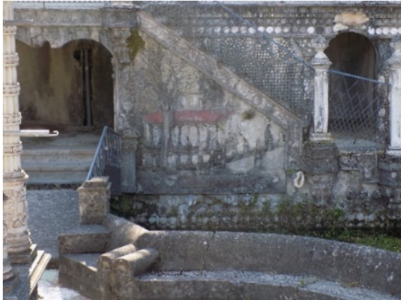
Figura 12. Árbol de Guernica.