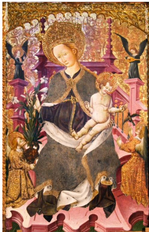
Imagen 15. María, reina de los cielos . Retablo mayor de la iglesia parroquial de Santa María la Mayor de Tosos (Zaragoza).

Fotografía: Taller de Restauración de Arte Mueble “Juan Arnaldín I” (Diputación de Zaragoza, 2011).