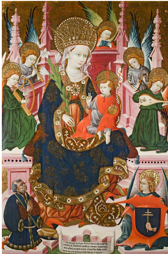
Retablo dedicado a la Virgen procedente de la capilla de Esperandeu de Santa Fe. Museo Lázaro-Galdiano, Madrid (nº de inventario: 2.857; dimensiones: 167 x 107 cm).