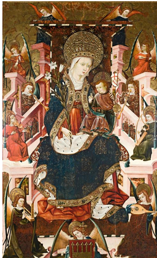
Museo de Zaragoza (nº de inventario: 10.037; dimensiones 233 x 143 cm).

El retablo mayor de la iglesia de Santa María la Mayor en Albalate del Arzobispo (municipio perteneciente a la comarca del Bajo Martín, en la provincia de Teruel) fue realizado por el pintor Blasco de Grañén entre 1437 y 1439 (Lacarra Ducay, 2003:3942;2004:24-28).