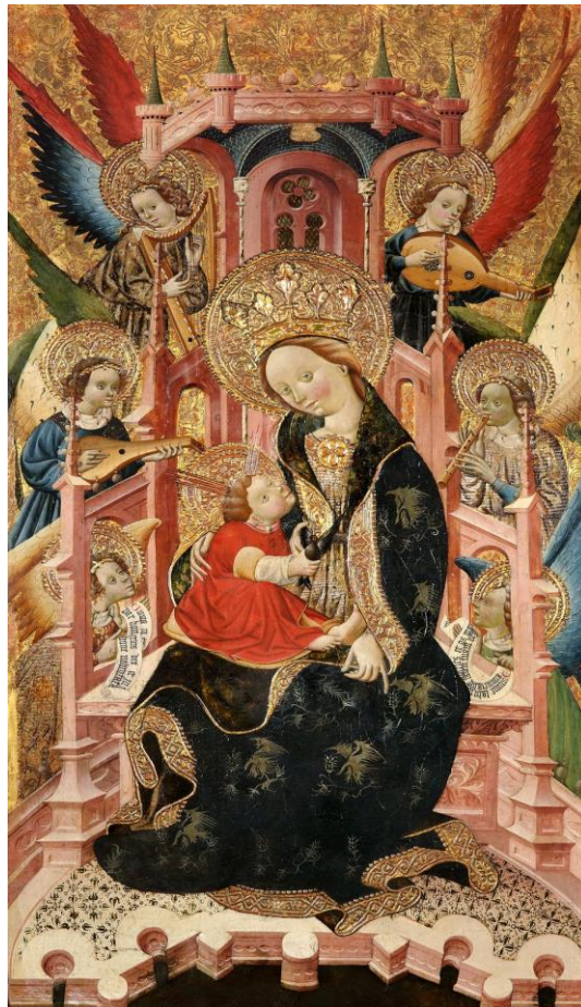
(dimensiones: 214 x 109 cm).

En la que sería la tabla central de un retablo dedicado a la Virgen, atribuido al taller de Blasco de Grañén -del que otras tablas están distribuidas entre el Museo de Bellas Artes de Bilbao y varias colecciones particulares- figura la Virgen María, entronizada como reina de los cielos con el Niño en su regazo, con ángeles músicos a los lados del trono. Esta pintura formaba parte de la colección del Marqués de Robert en Barcelona en el año 1937, junto a otras once tablas del mismo retablo, que sería similar en su composición a los de Lanaja y