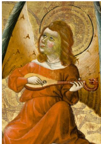
Imágenes 7 y 8. Detalle de dos ángeles con guitarra y chirimía. Retablo mayor de la iglesia parroquial de Santa María la Mayor de Albalate del Arzobispo (Teruel)