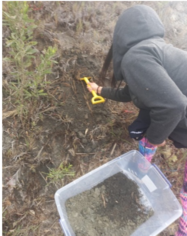
Figura 2. Toma de muestra del relave minero ubicado en el humedal el Culebrón.