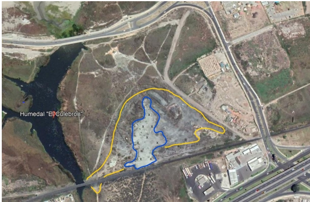
Figura 1. Vista del humedal el Culebrón, con la presencia del relave, línea azul límite físico del relave, línea amarilla, desplazamiento de material del relave por factores geo ambientales, X puntos de toma de muestra.

Las muestras, se tomaron del relave ubicado en el humedal el Culebrón, ubicado en la zona urbana de la ciudad de Coquimbo, como se muestra en la figura 1. En la figura 2 se puede observar el proceso de toma de muestras en el relave.