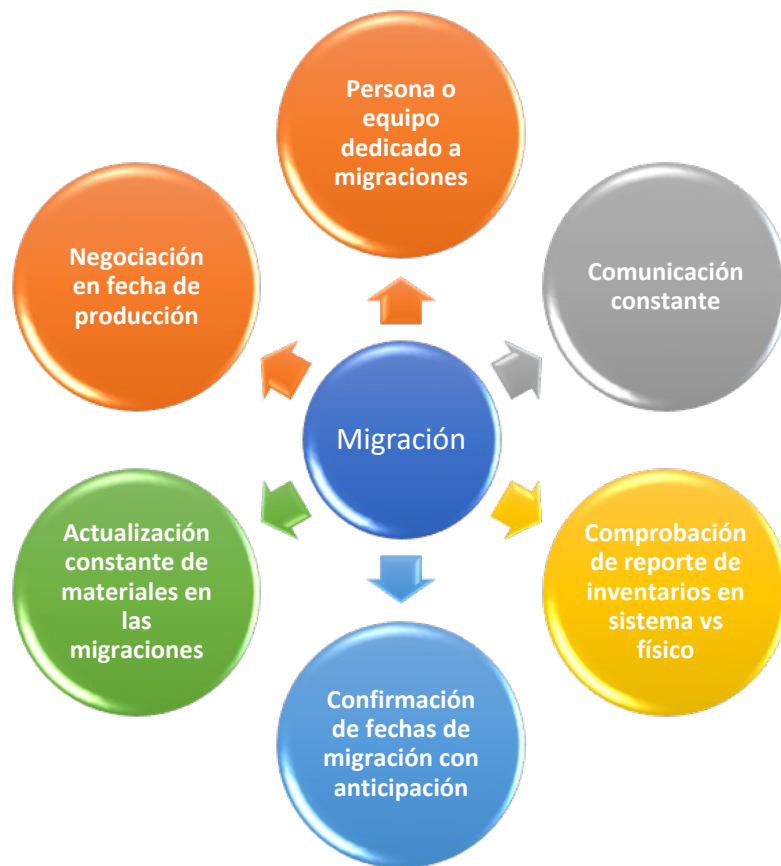
Figura 2. Requerimientos para migración