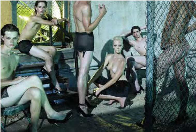
Figura 5: Asexual Revolution.

La turbación que produce esta representación idealizada de Meisel reside quizás en la ruptura y transgresión de las normas aprehendidas culturalmente sobre el género y el cuerpo. En este trabajo, agrade el ideal sexual binario y mezcla los géneros para definirlos en uno único.