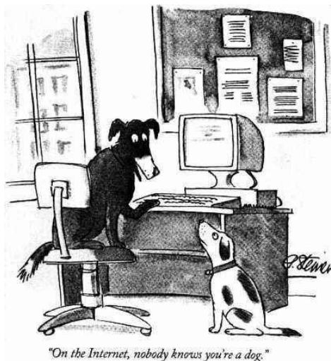
Figura 1: On the Internet, Nobody Knows You're a Dog. Fuente: Peter Steiner, The New Yorker , 1993.

La identidad surgiría en espacios del otro, donde se experimenta la diversidad y podemos desprendernos, aún temporalmente, del estigma de nuestro sexo, edad o raza. [...] Así, el que desea no ser nadie actúa y se presenta con diferentes identidades, “juega a ser” (Zafra, R., 2004: 38).