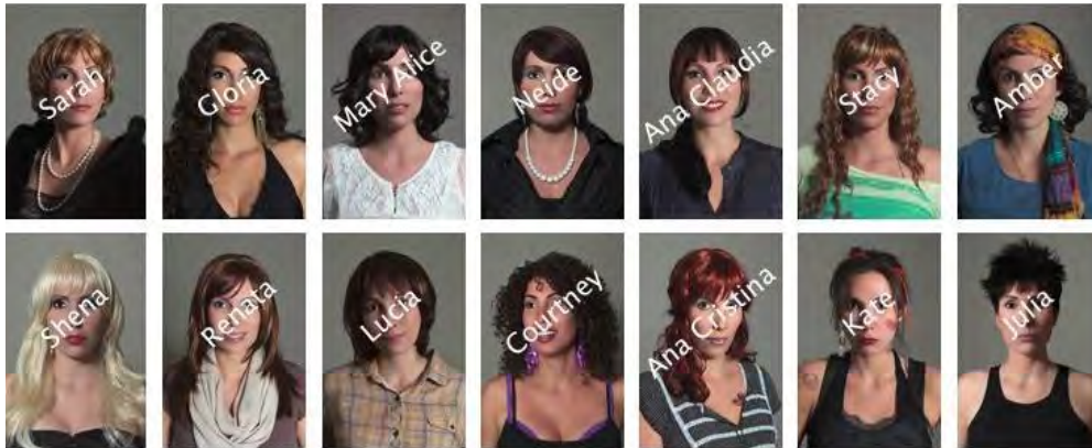
Figura 3: Born Nowhere.

Lais Ponte emplea la misma plataforma social en el proyecto Born Nowhere . La artista brasileña elabora distintos avatares a partir de su autorretrato 8 , modificado digitalmente, que adquieren nuevas personalidades. Ponte, a través de los procesos colaborativos crowd-sourcing , solicita la participación por parte de los usuarios de la red social a modo de comentarios e interpretación de las fotografías: