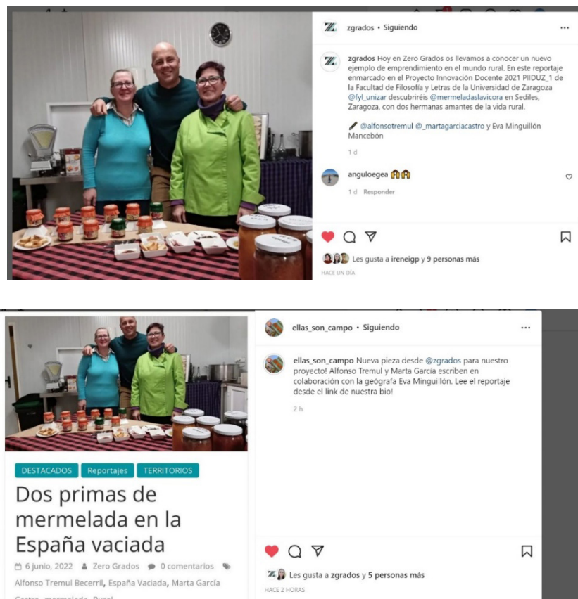
Figura 11. Difusión en Instagram del caso Mermeladas La Vicora