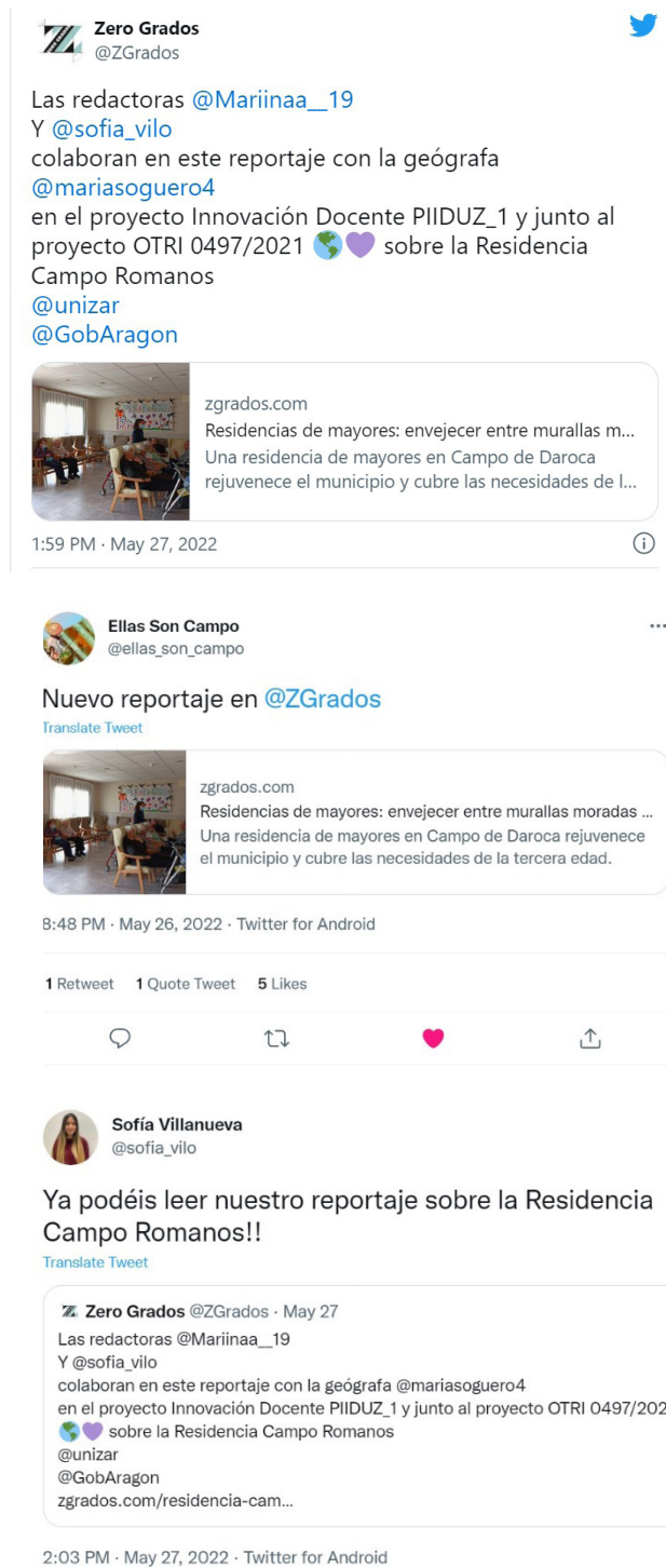
Figura 9. Difusión en redes del caso Residencia Campo Romanos